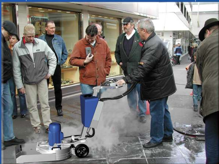
MAINZ VORFÜHRUNG KAUGUMMI-ENTFERNER

STUNDENLEISTUNG: BIS ZU 150 M 2 PRO STUNDE JE NACH ZUGÄNGLICHKEIT UND INFRASTRUKTUR.