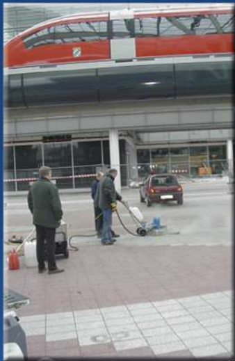
MÜNCHEN IC-BAHNHOF FLUGHAFEN